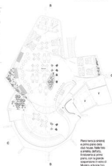
Piano terra (a sinistra) e primo piano della club house. Nelle foto a sinistra, dall'alto, il ristorante al primo piano, con la grande sospensione in vetro di Murano, e la spa